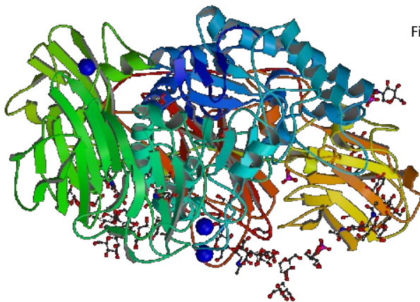
Figur 3. \beta -galactosidase.

Det kommercielle enzym 'Lactozym' er en \beta -galactosidase fra en gær celle. Det er et stort molekyle med en molarmasse på 464.000 g/mol, da det består af fire ens peptidkæder på hver 1024 aminosyrer. Det anvendes som markørenzym i bioteknologi, da der findes en række kunstige substrater der omdannes til farvede forbindelser.