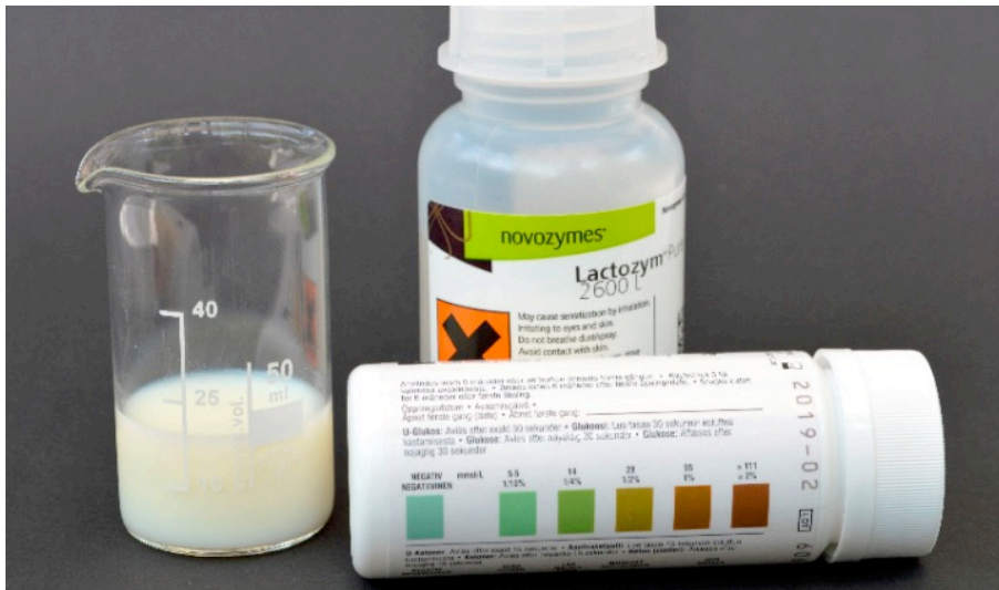
Figur 2. Skalaen på Diastixpakken, Lactozym og mælk. Figur 101, side 88 Bioteknologi A bind 1.

Glucoseoxidase oxiderer specifikt glucose til glucuronsyre og producerer hydrogenperoxid som starter peroxidase reaktionen. Derfor er målingen med Diastix specifik for glucose. Andre carbohydrater (lactose, galactose m.fl.) giver ikke farvning af Diastix'en.